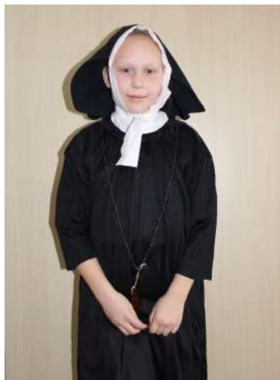
Non (hoofdkap zit op deze foto niet juist)